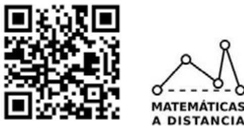
Figura 2: Imágenes del anuncio 2.2.

Para más información sobre el proyecto, oportunidades de colaboración y acceso a los contenidos, se puede visitar el sitio oficial en el siguiente enlace, seguir sus redes sociales en Facebook o contactar a través del correo electrónico colaboraciones@mdistancia.com .