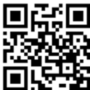
Figura 19: Imágenes del anuncio 5.6.

Las inscripciones para participar en la escuela se encuentran abiertas y deben realizarse exclusivamente a través de la página oficial del evento. Para más información sobre el programa, registro y detalles logísticos, se puede consultar el siguiente enlace.