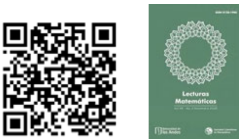
Figura 1: Imágenes del anuncio 2.1.

Para más información sobre el proceso editorial, normas para autores y envíos, se puede consultar el sitio oficial en el siguiente enlace . Cabe destacar que Lecturas Matemáticas se encuentra indexada en bases de datos reconocidas como MathSciNet, zbMATH Open y Dialnet, lo que garantiza visibilidad internacional y la adecuada difusión de los trabajos publicados. Los artículos publicados están disponibles en acceso abierto en formato PDF desde el sitio de la Sociedad Colombiana de Matemáticas.