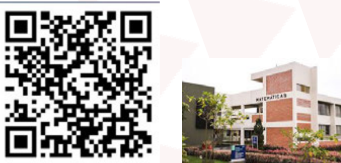
Figura 18: Imágenes del anuncio 5.5.

Para información sobre el programa, registro y detalles logísticos, los interesados pueden consultar la página oficial del evento en el siguiente enlace.