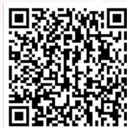
Figura 21: Imágenes del anuncio 5.8.

Para mais informações e acesso ao formulário de inscrição, consulte o seguinte enlace ou entre em contato pelo e-mail fernando.santos@ufam.edu.br .