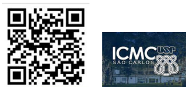
Figura 17: Imágenes del anuncio 5.4.

Para obtener más información sobre el programa, registro y detalles del evento, los interesados pueden consultar la página oficial en el siguiente enlace.