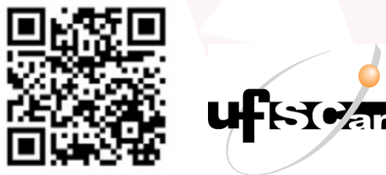
Figura 5: Imágenes del anuncio 3.2.

Para obtener más información sobre los programas de posgrado, procesos de admisión y oportunidades de financiamiento, consulte el siguiente enlace.