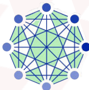
Figura 24: Imágenes del anuncio 5.11.