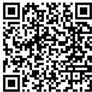
Figura 3: Imágenes del anuncio 2.3.

Asimismo, en mayo de 2026 se publicará el primer número del año, el cual continúa consolidando el enfoque actual del Noticiero, orientado a una mayor integración y visibilidad de la comunidad matemática. Como referencia, se puede consultar un número reciente en el siguiente enlace.