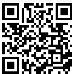
Figura 20: Imagen del anuncio 5.7.

La fecha límite de inscripción es el 11 de marzo de 2027. Para más información sobre el programa, requisitos y proceso de inscripción, se puede consultar el siguiente enlace.